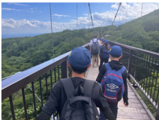
那須高原トレッキング

私は、夏休みの始めと終わりにラジオ体操に参加しました。朝早くからたくさんのこどもたちと一緒に体操し、体を動かす気持ちよさを感じました。また、7月下旬からは、2泊3日の那須宿泊学習に5年生と一緒に行きました。農家民泊という貴重な経験をしている時のこどもたちの表情は、学校で見せる笑顔にも増して、素敵で笑顔でした。そして、8月中旬には、地域のお祭りが6年ぶりに開催されました。3日間のうち1日でしたが、私も参加させていただきました。いつもと違う活力を感じることができ、八名川小学校のあるこの地域がますます好きになりました。夏休みの最後には、ラストサマーが行われました。体育館で体を動かす競争、図書館で協力して高さを競うゲーム、校庭での水遊びで、こどもたちは夏休み最後の楽しい時間を過ごしていました。