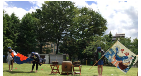
「礼」をする6年生 (5/29リハーサル)

先日の全校集会で、「礼」について話をしました。スポーツのあいさつや人と会ったときに行う「礼」。感謝と尊敬の気持ちが込められているのが「礼」。人と人が気持ちよく関わるためのエチケットとして行う「礼」。集会の最後に、こんな話をしました。「110年という長い歴史のある八名川小学校の運動会を、私たちの感謝と尊敬の気持ちを込め、誰もが気持ちよく感じるエチケットとして『礼』を大切にしましょう」と。