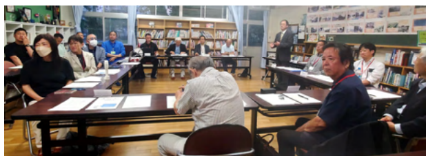
第1回学校運営協議会の様子

《全校遠足付き添いボランティアの募集》にはたくさんのお申し込みをいただきました。ありがとうございました。応募された方へは6月10日(水)を目途にチームやながわ事務局よりメールにて詳細をご連絡させていただきます。全校遠足の予備日はありません。